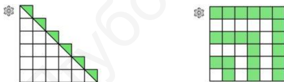
Рис. 1: задача 5 и задача 6

На картинках ниже приведены доказательства некоторых математических тождеств. Ваша задача — понять, о каких тождествах идет речь и доказать их, глядя на картинку.